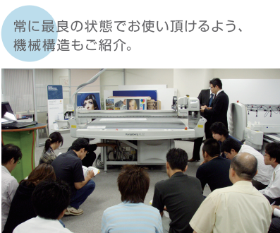
常に最良の状態でお使い頂けるよう、 機械構造もご紹介。